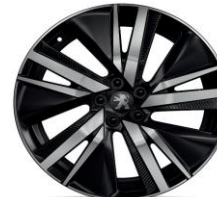
19" 'San Francisco'