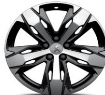
18" 'Los Angeles'