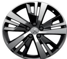
18" 'Detroit' Storm Grey