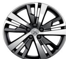
18" 'Detroit' Onyx Black